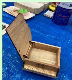
こちらが木のピアノ小物入れ。完成度が高くて喜ばれました