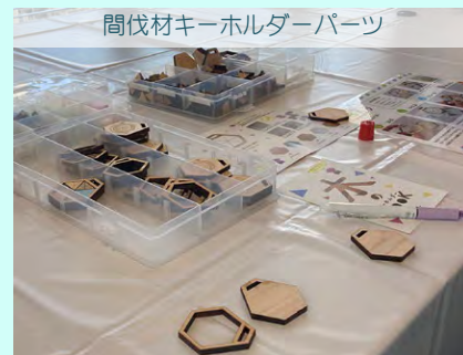
間伐材キーホルダーパーツ