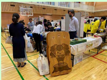
中央区環境土木部環境課ブース

当日は朝からあいにくの雨模様でしたが、大勢のお客様にご参加いただきました。今回は中央区の間伐材を利用したとっても可愛いピアノ型の小物入れを作りました。子どもも大人も一目見るなり「作りたい！」とブースは大盛況。組み立ては少し難しいものの、出来上がると「何入れようかな～！」、「楽しかったです。」という方や、「間伐材ってこんな風に使えるんですね。」というお声が印象的でした。小物入れを通じて中央区の森を感じていただけた嬉しい一日でした。