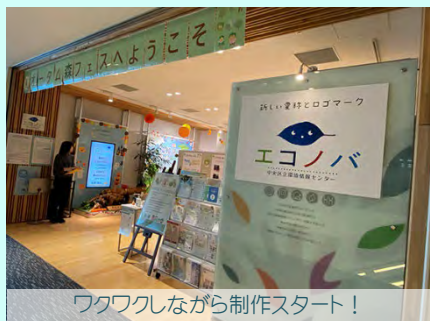
ワクワクしながら制作スタート！

キーホルダーの表面6カ所に3角形の間伐材5個とアロマストーンを置くのですが、木の種類により色や模様が異なるため、「どんな組み合わせにしようかな」と楽しみながら仮置きを繰り返し制作しました。その甲斐あって、それぞれの思いが形になり満足感のある素敵な作品が完成しました。「木によって色と香りが違うのがわかった」「木は地球にとって大事なと思った」との感想もいただき、「木を身近に感じることから環境問題に関心を持っていただきたい」という思いを感じただけのワークショップとなりました。