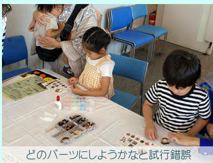
どのパーツにしようかなと試行錯誤