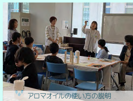
アロマオイルの使い方の説明