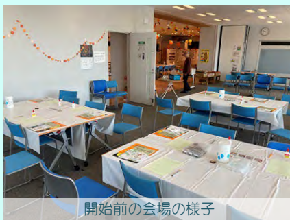
開始前の会場の様子