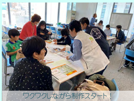
ワクワクしながら制作スタート！