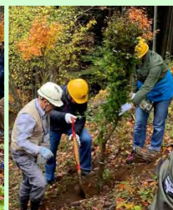
斜面での慣れない植林作業は大変。