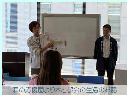
森の応援団より木と都会の生活のお話