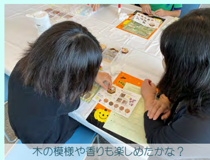
木の模様や香りも楽しめたかな？