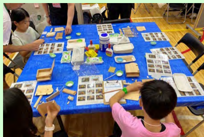
親子連れで参加される方が多く大盛況！