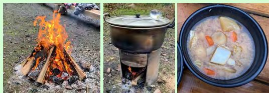
温かい猪鍋で身体も心もホッとしました。