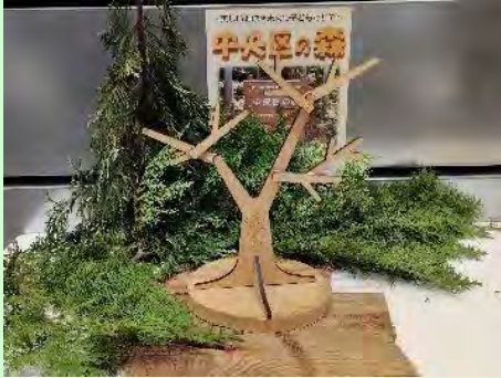
最後はフォトスポットで撮影