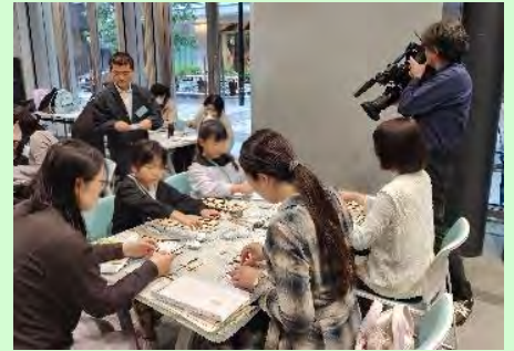
イメージを膨らましながらか作成される様子