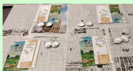
当日はこのような机にセットしました