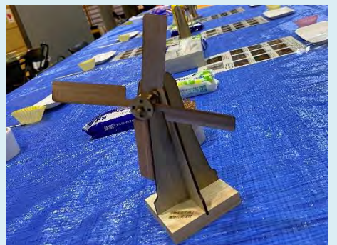
ブレード部分が回る風車