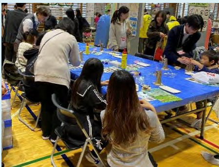
会場の様子：保護者も一緒になって夢中で作っていました

朝からの雨にもかかわらず、会場は多くの来場者で賑わっていました。区のブースで中央区の森の間伐材を使った小物作りのお手伝いをしながら、中央区の森についての説明などもいたしました。今回の制作物はブレード部分が回る素敵なデザインの風車です。区のご担当が「皆さんが喜ぶものを作りたい！」と毎回時間をかけて熱心に考えていらっしゃるそうです！回る風車を見た子どもたちは「これ作りたい！！」と、目を輝かせて参加してくれました。今回は、中央区の森のことを「知っています」と答える方が増え、中央区の森への認知度と環境への関心の高まりを感じるイベントでした。